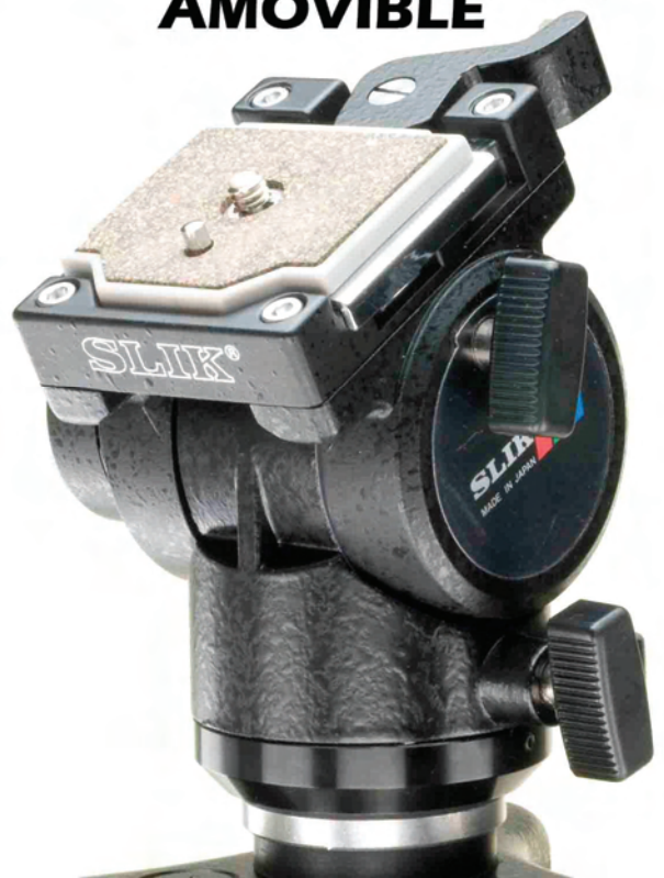
PLATINE FIXATION AMOVIBLE