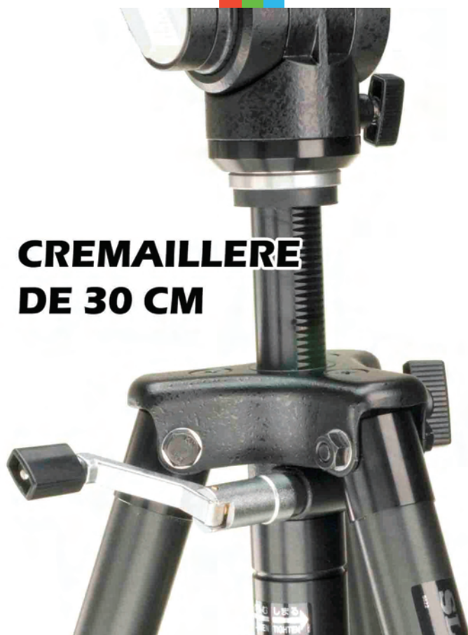
CREMAILLERE DE 30 CM