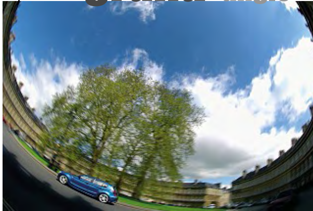
AF Fisheye-Nikkor 16 mm f/2.8D © Tim Andrew