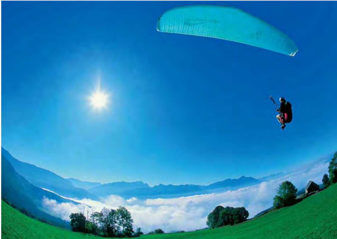
Fisheye pleine image pour des vidéos étonnantes