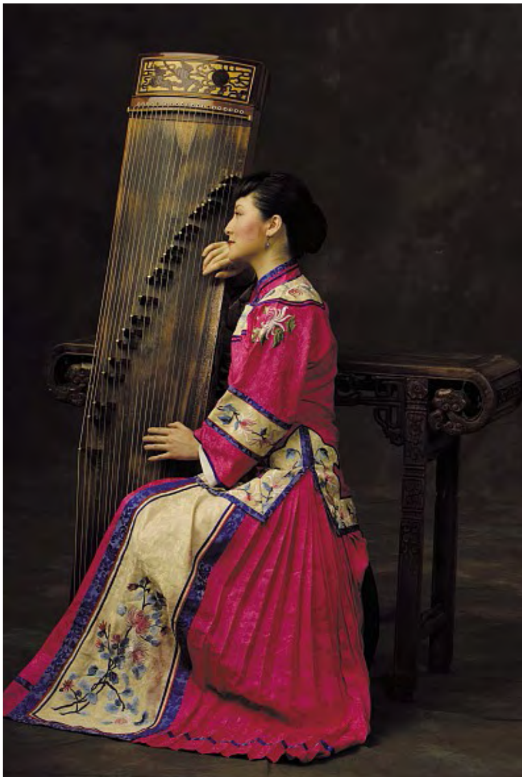
AF Nikkor 50 mm f/1.8D

Grands-angles et standard AF Nikkor : principales caractéristiques